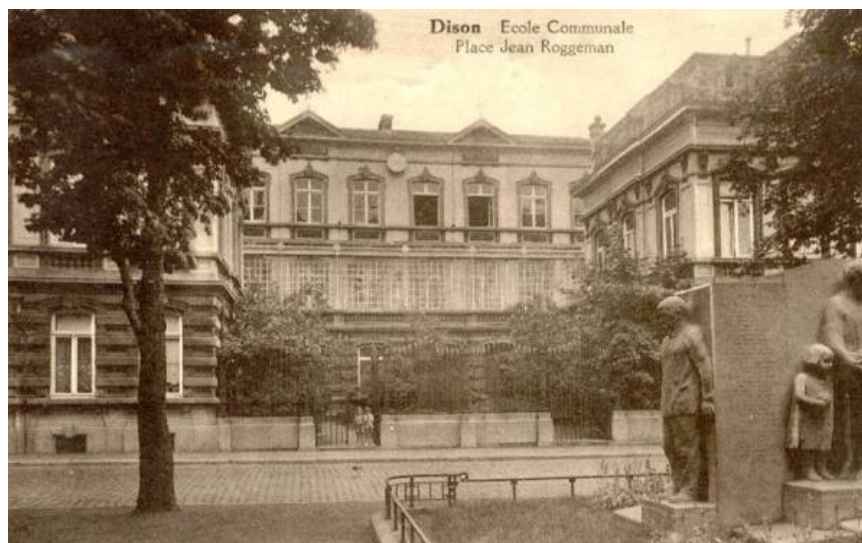
Cartes postales anciennes (non datées)

||| Accueil - Onthaal ||| Noms - Namen ||| Monuments - Monumenten ||| En souvenir - Ter herinnering ||| Nouveau - Nieuw ||| Moteur de recherche - Zoekmachine ||| Statistiques - Statistieken ||| Insolite - Merkwaaardig ||| Sources - Bronnen ||| Livre d'Or - Gastenboek ||| Remerciements - Dankzegging ||| Liens - Links ||| Distinctions honorifiques - Eretekens ||| Abréviations - Afkortingen ||| Glossaire - Woordenschat