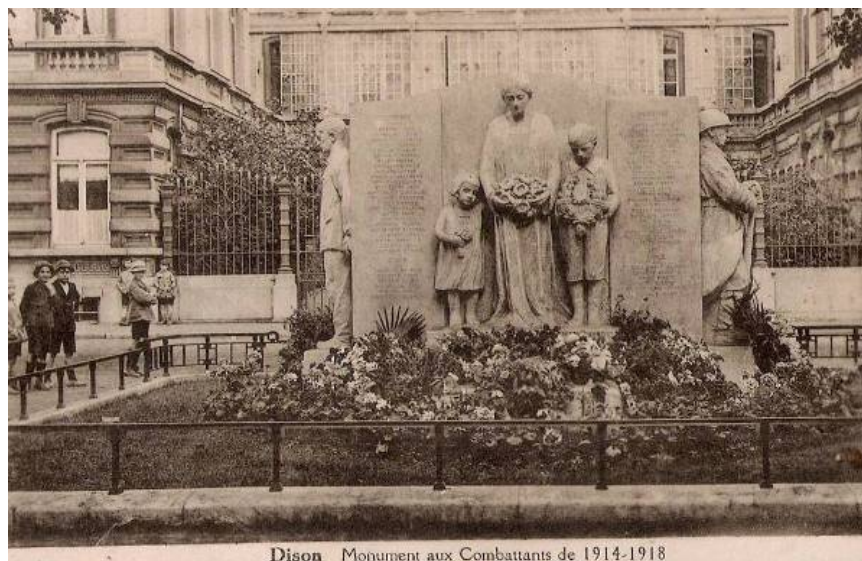
Dison Monument aux Combattants de 1914-1918