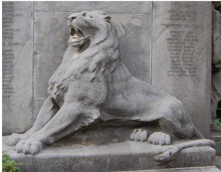
Photos prises en août 2008 et aimablement transmises par M. Albert SIMON de Petit-Rechain